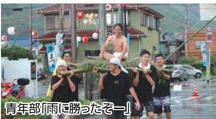
青年部「雨に勝ったぞー」