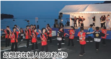
幻想的な婦人部のおどり