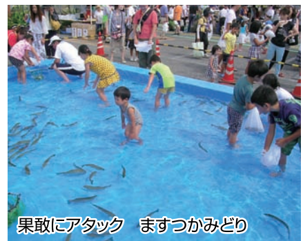
果敢にアタック ますつかみどり