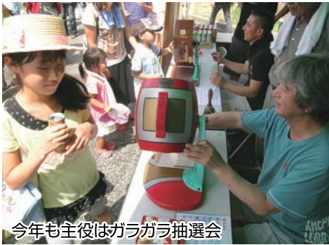
今年も主役はガラガラ抽選会