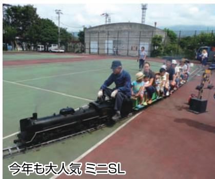
今年も大人気 ミニSL