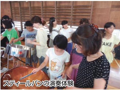
スティールパンの演奏体験

それでも、総勢三十名に及ぶ大編成の演奏は圧巻の音圧。戸田に南国の音色が響き渡りました。