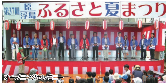
オープニングセレモニー