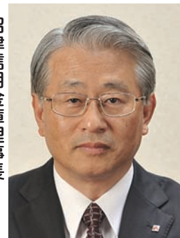
沼津信用金庫理事 長 沼津商工会議所副会頭