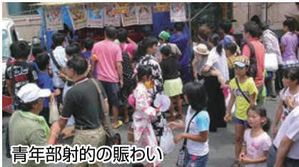
青年部射的の賑わい