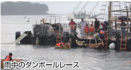
雨中のダンボールレース