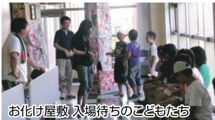
お化け屋敷 入場待ちのこどもたち

中、マスのつかみ取り、ミニSLの会場から、大きな笑い声や歓声が聞こえてくる。みんな楽しそう。子供は祭りの主役だ。毎年人気があるお化け屋敷からは、悲鳴のような声が続いてくる。会場から出てきた子供たちが、怖かったと言いつつ、怖がりながらも又会場に入っていく。