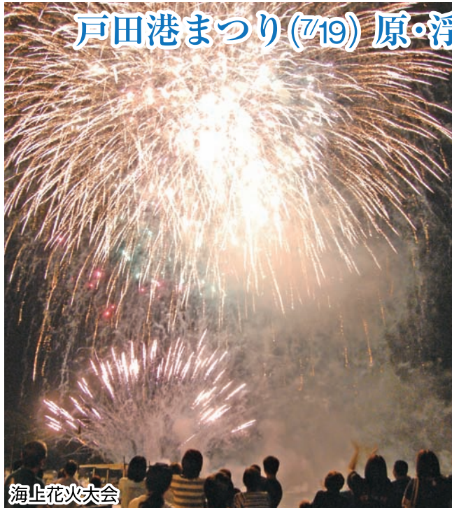
戸田港まつり(7/19) 原・浮島ふるさと夏まつり(8/2)

発行者 沼津市商工会 会長 大村保二 〈本所・原支所〉沼津市原1200番地の1 TEL(055)966-1331 FAX (055)967-4925 〈戸田支所〉沼津市戸田1028番地の5 TEL(0558)94-2224 FAX (0558)94-4029 編集 沼津市商工会広報委員会