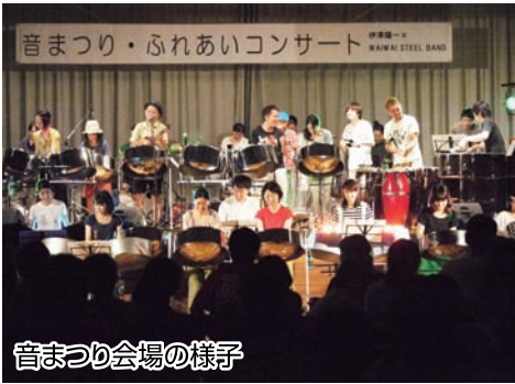
音まつり会場の様子

戸田には、盲目の旅芸人、瞽女(ごぜ)を祭った瞽女観音があり、芸道の祖としてその道を志す人々から信仰を集めています。それにちなみ、戸田を「若手アーティストのヒット祈願の街」として盛り上げようと、今年、音まつり実行委員会が立ち上がり、お祭りが初開催されました。今回は、ドラム缶から造られる「スティールパン」とい