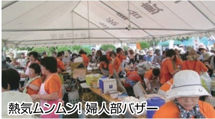
熱気ムンムン! 婦人会バザー